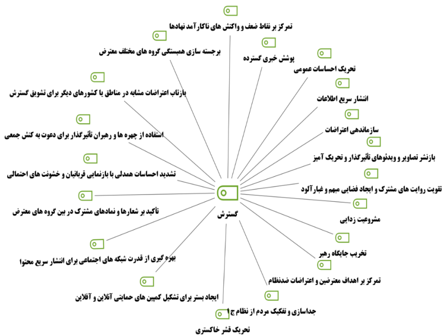
نمودار ۲. مؤلفه‌های مؤثر در گسترش ناآرامی

با استفاده از نرم‌افزار MaxQDA، نمودار ارتباطی مؤلفه‌های مؤثر در مرحله‌ی گسترش در ناآرامی‌های ۱۴۰۱ طراحی و خروجی آن به شرح نمودار شماره ۲ قابل مشاهده است.