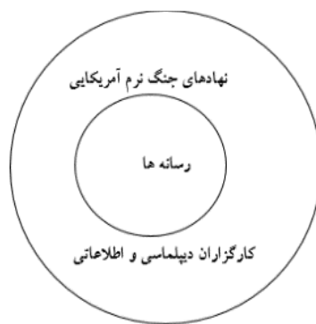
شکل ۱. تاکتیک برجسته‌سازی در مذاکرات هسته‌ای

با توجه به پژوهش موردنظر، در مذاکرات هسته‌ای، طرفین مذاکره بارها در جنگ رسانه‌ای خود با برجسته‌سازی اقدامات و تحرکات، پیشبرد اهداف را فراهم می‌ساختند. براساس این نظریه عوامل اجراکننده عملیات روانی بر عهده دو گروه کلی رسانه‌ها و بخش دیپلماسی، اطلاعاتی و نهادهای جنگ نرم آمریکا بود. در واقع این دو عوامل نقش عوامل برون سازمانی و درون سازمانی نظریه برجسته‌سازی را ایفا کرده‌اند. رمز موفقیت این دو عامل در همپوشانی و تعامل راهبردی با هم است. ادعایی که در ادامه با تحلیل محتوایی عملکرد کارگزاران جنگ نرم آمریکا با بهره‌گیری از سازوکارهای عملیات روانی مورد ارزیابی قرار گرفته است. در یک جمع‌بندی کلی از بحث نظری این مقاله می‌توان گفت ساخت آگاهی عمومی مرتبط با موضوعات بازیگران از محیط بین‌الملل و رفتار دیگران متأثر از تجربه و زمینه تاریخی آن‌ها نسبت به «خود» از «دیگران» است. در چنین شرایطی، مسئله‌سازی، دوستی و دشمنی را خود دولت‌ها بنا بر محیط ذهنی خویش که انباشته از تجربیات زمینه‌مند است، تعریف می‌کنند. مطابق با این طرز فکر وجود یک سلاح در دست یک دوست، متفاوت از وجود همان سلاح در دست دشمن است. آمریکا با استفاده از ظرفیت‌های داخلی و بین‌الملل خود نسبت به ایجاد ساخت عمومی موضوعات برای مواجهه یا فعالیت‌های هسته‌ای ایران و به‌ویژه مذاکرات هسته‌ای اقدام کرده است.