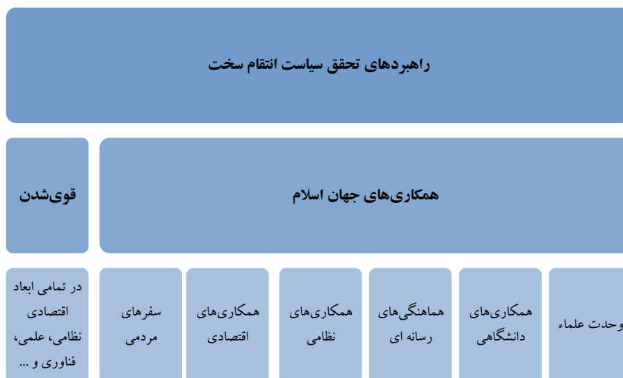
شکل ۶. راهبردهای اصلی و فرعی تحقق سیاست انتقام سخت مبتنی بر بیانات رهبر معظم انقلاب اسلامي