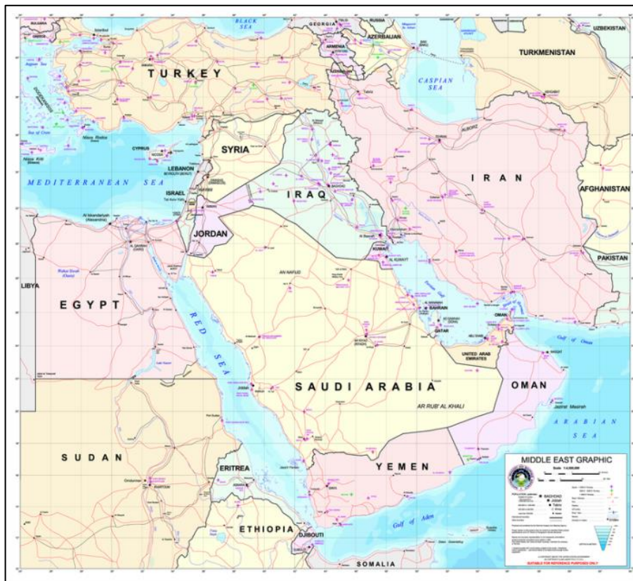
تصویر ۱. نقشه منطقه غرب آسیا (خاورمیانه)

به اعتقاد بسیاری از اندیشمندان، در میان مناطق ژئوپلیتیکی که نقش و جایگاه آن در عرصه نظام بین‌المللی ارتقا یافته، قسمت جنوب غربی آسیا و به‌ویژه منطقه خاورمیانه می‌باشد (اخباری و ایازی، ۱۳۸۶: ۳۷). این منطقه ۸۵ درصد مسلمانان جهان و بیش از ۶۵ درصد منابع نفتی و گازی دنیا (جدای از منابع زمینی و طبیعی دیگر) را دربرمی‌گیرد و به‌دلیل وجود مؤلفه‌هایی مانند تنوع و گستردگی قومی - مذهبی، اختلافات مرزی، حکومت‌هایی با اشکال مختلف و استقرار رژیم صهیونیستی در این منطقه، به یک کانون بحرانی در جهان تبدیل شده است (بیگدلی، ۱۳۸۵: ۶۲). هم‌چنین، این منطقه نقش مهمی در نظام دینی و عقیدتی جهان دارد و ادیان آسمانی یهودیت،