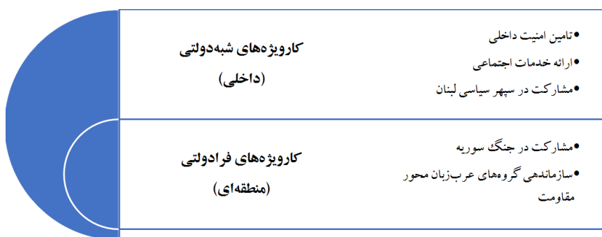
شکل ۲. مدل مفهومی: حزب‌الله لبنان به عنوان یک بازیگر ترکیبی

جنگ سوریه و مدیریت گروه‌های عرب‌زبان محور مقاومت مهم‌ترین نشانگان این امر محسوب می‌شود.