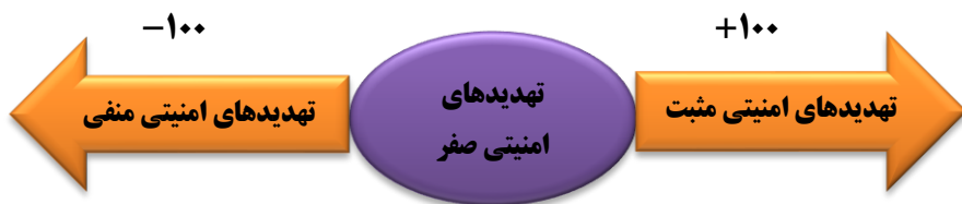
شکل ۱. طیف‌بندی محیط تهدیدهای امنیتی ج.ا.ایران