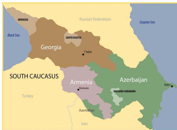
شکل ۱- چیدمان و موقعیت قفقاز جنوبی و جمهوری‌های آن

موقعیت ویژه‌ای برای نفوذ و حمله به همسایگان و مناطق پیرامونی خود دارد و هم موقعیت مناسبی برای دفاع از مناطق پیرامونی خود و همین‌طور دفاع و مقابله در برابر تهاجم همسایگان. قفقاز جنوبی موقعیت ممتازی برای مسیرهای حمل و نقل و تجاری مانند مسیرهای انتقال انرژی به شمار می‌رود. در کنار موقعیت استراتژیکی قفقاز جنوبی که باعث جلب توجه و حضور قدرت‌های منطقه‌ای و فرامنطقه‌ای شده، برخی مشکلات دیگر مانند محصور بودن در خشکی باعث وابستگی این جمهوری‌ها به کشورهای دیگر شده است. بین سه جمهوری قفقاز جنوبی، فقط گرجستان به آب‌های آزاد دسترسی دارد و ارمنستان از این لحاظ بدترین وضعیت را دارد. جمهوری آذربایجان نیز تنها در کنار دریاچه بسته خزر واقع شده است. جمهوری آذربایجان در دریای خزر ساحل دارد که دسترسی این دریا به دریای آزاد از مسیرهای آبی از داخل خاک روسیه است. هم‌جواری این منطقه و جمهوری مذکور با دریای خزر، موضوعی است که به ویژه با توجه به تعیین نشدن رژیم حقوقی دریای خزر و سعی هر یک از کشورهای ساحلی برای افزایش سهم خود از این دریا، برای امنیت جمهوری اسلامی ایران حایز اهمیت است؛ لذا در بررسی عامل توپوگرافی (مرزها) به این مهم پرداخته خواهد شد.