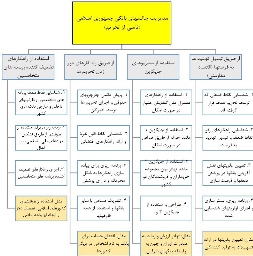
شکل ۱- الگوی مفهومی مدیریت ریسکهای بانکی جمهوری اسلامی

الف) مدیریت ریسکها از طریق تبدیل تهدیدها به فرصتها بر مبنای مدل برنامه ریزی استراتژیک، برآیند نقاط ضعف و تهدیدها بیانگر اولویتهای و برآیند نقاط قوت و فرصتها نشان دهنده ظرفیتهای هستند. با این رویکرد برای مدیریت تحریمها در ابتدا باید نقاط قوت و ضعف و فرصتها و تهدیدها را شناسایی و سپس ظرفیتهای و اولویتهای آنها را استخراج کرد. در مورد تحریمهای بین المللی، شناسایی نقاط ضعفی که هدف قرار گرفته اند با بررسی ماهیت تحریمها و گزارشهای داخلی تحریم کنندگان ممکن خواهد بود. مهم ترین این نقاط ضعف که در گزارش کنت کاتزمن ۱ (F35) به کنگره آمریکا به آن اشاره شده، عبارت است از وابستگی دولت ایران به درآمدهای نفتی که حدود ۷۰ درصد از درآمد دولت ایران را به خود اختصاص داده است.